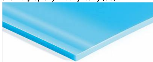
stránka přepravy: Hladký lesklý (SG)