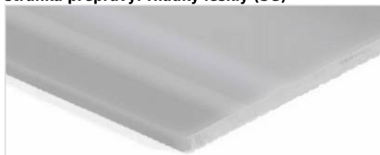
stránka přepravy: Hladký lesklý (SG)